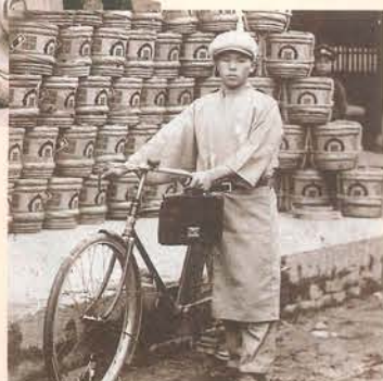
自転車で集金 店頭と並んだ醤油の木樽