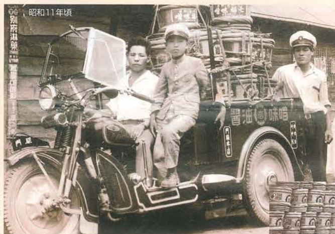
昭和11年頃 業務用のしょうゆと味噌は木樽で配達していました

※日清戦争(明治27年)頃からインフレにより価格が上昇しています。 ※表は当社調査による平均的価格です。