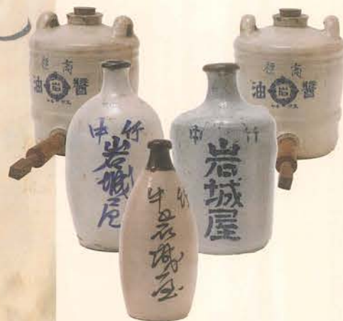
明治時代、醤油の容器は「とっくり」が使用されていました

約135年前の価格表です しょうゆ1.8リットルの 代金は4銭宝 右の通り小売価格を 定めます 明治7年四月 醤油屋