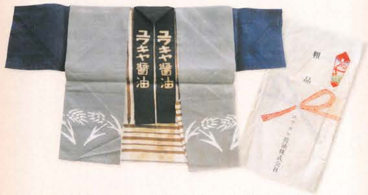
●ハッピーの形に折込んだ手ぬぐい、当時(昭和30年代)の粋な遊び心を入れた粗品。