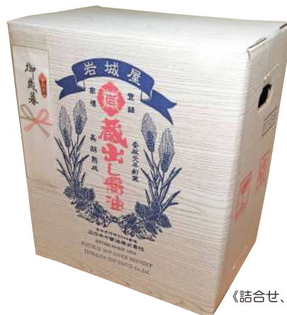
《話合せ、アラカルトでご注文いただいた場合》